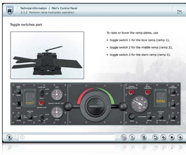
Beispiel WBT: Hydraulik der Rampen | Example WBT: Ramp hydraulic